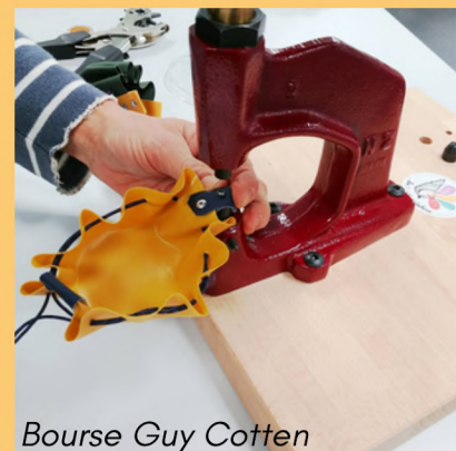
Bourse Guy Cotten