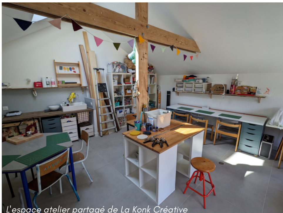
L'espace atelier partagé de La Konk Créative

Le tarif indiqué est un tarif plafond matériel compris. Il sera ajusté sur devis en fonction du nombre de prestations choisies. L'accompagnateur bénéficie de la gratuité.