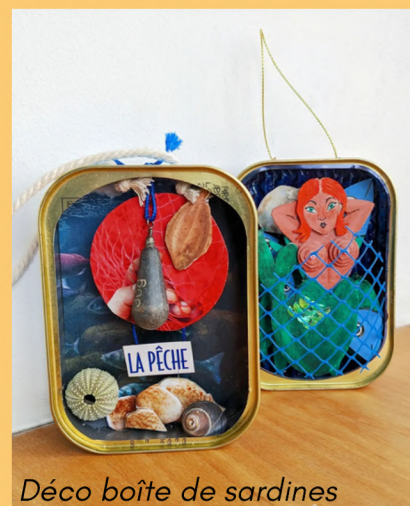
Déco boîte de sardines

Forfait groupe 120€ (chacun repart avec sa boîte "up cyclée")