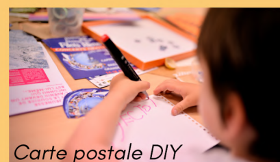
Carte postale DIY

Forfait groupe 80€ (chacun repart avec sa carte postale)