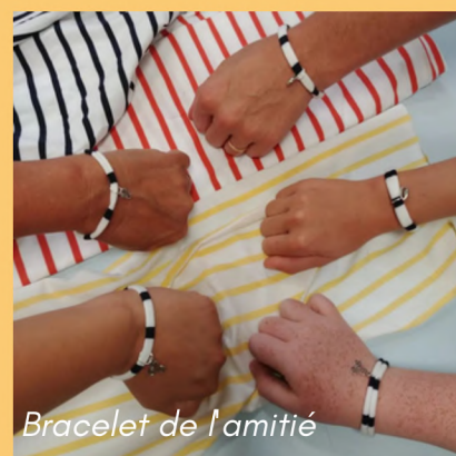
Bracelet de l'amitié

Forfait groupe 120€ (chacun repart avec 2 bracelets)