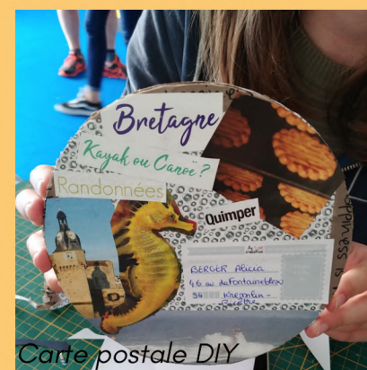
Carte postale DIY